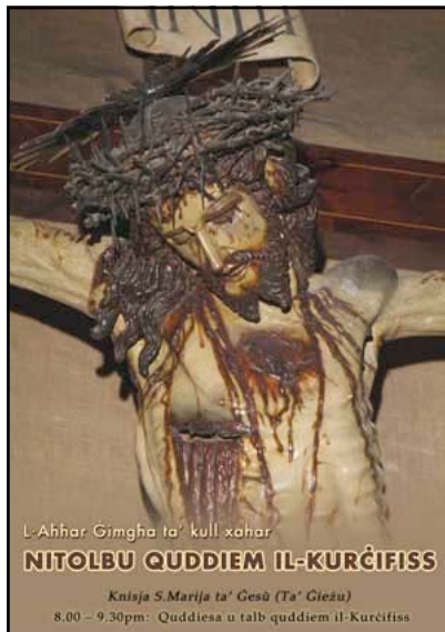
L-Aħħar Ġimgħa ta' kull xahar NITOLBU QUDDIEM IL-KURĊIFISS Knisja S. Marija ta' Ġesù (Ta' Giezu) 8.00 - 9.30pm - Quddiesa u talb quddiem il-Kurċifiss

Monthly Prayer Meeting. Soprana, from Sicily, and was brought to Malta by the Franciscan fraternity of the church of Saint Mary of Jesus (Ta' Giezu) in Valletta, is going to organize a monthly prayer meeting in front of the miraculous Crucifix venerated in this church. The prayer meeting is to be held every last Friday of every month from 8 till 9.30pm.