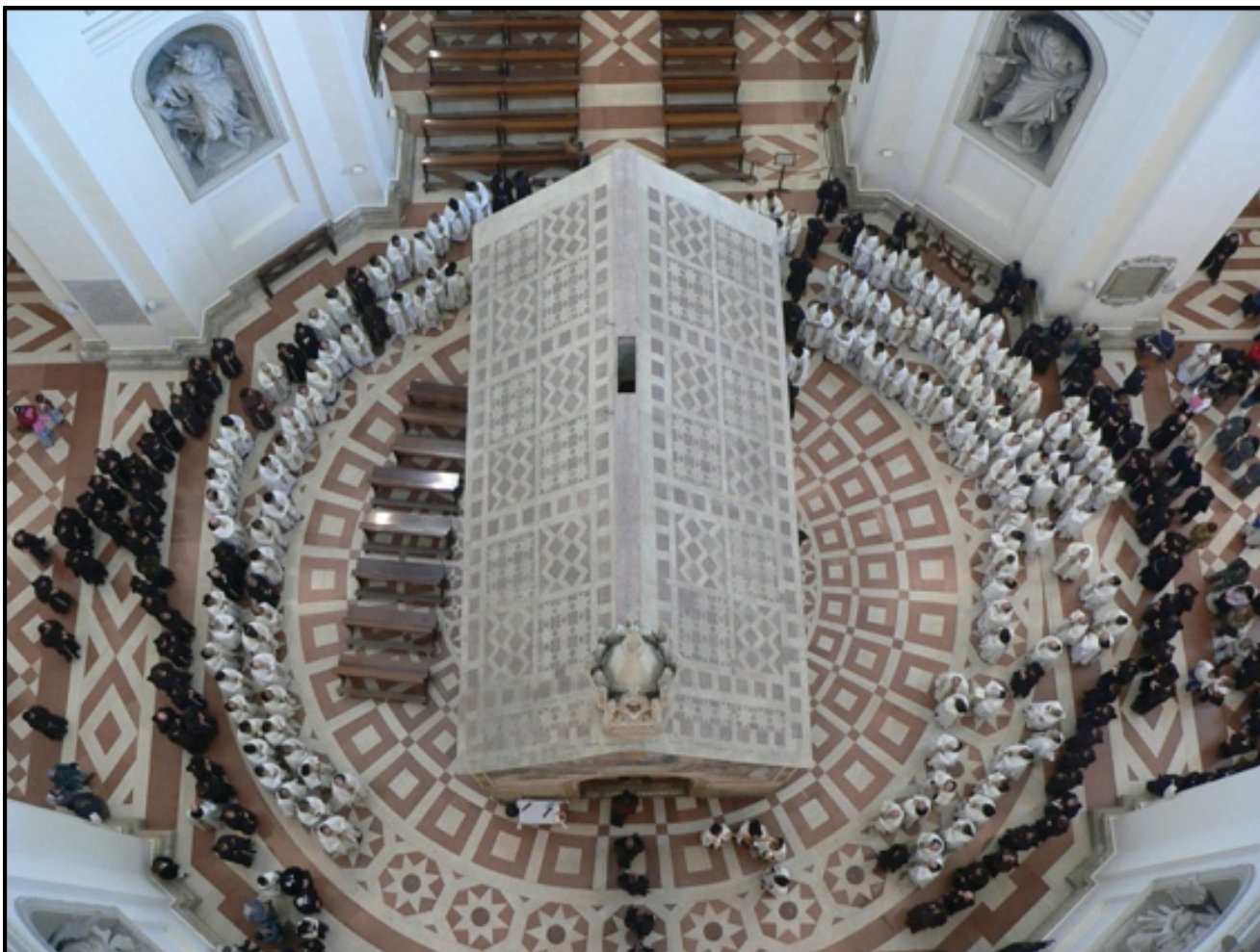
Ftuħ taċ-ċelebrazzjonijiet fil-Porziuncola ta' VIII Ċentinarju ta' l-approvazzjoni tar-Regola .

PROVINĠJA FRANĠISKANA TA' SAN PAWL APPOSTLU, MALTA. No. 108 20.1.2006